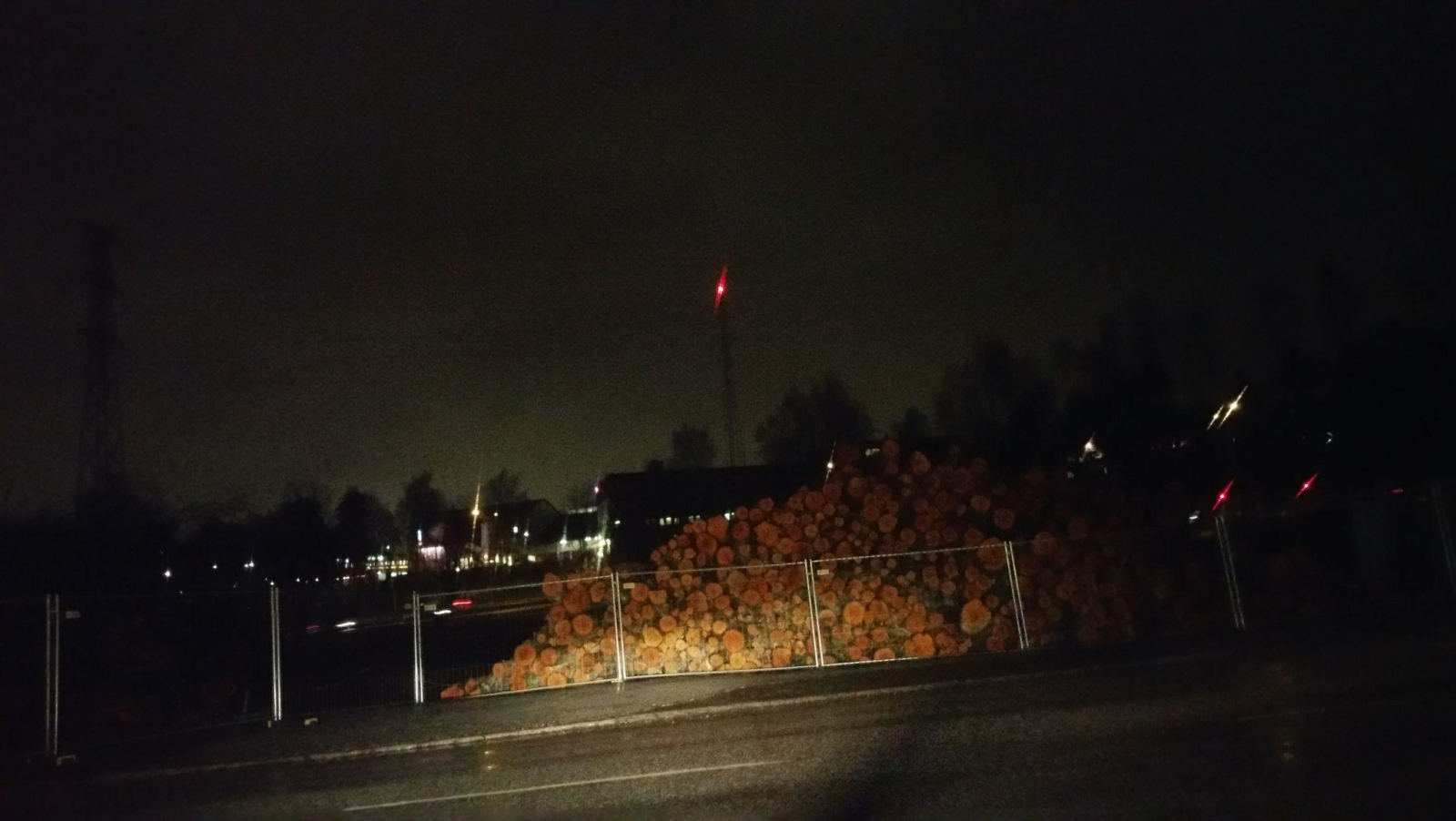
Träd som stod mellan Tyresövägen och Sandåkravägen