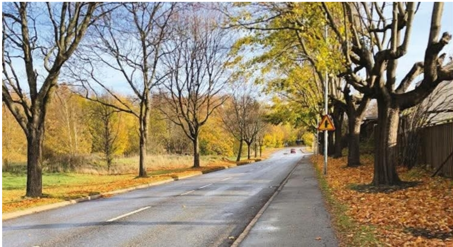
Medborgarförslagets omslagsbild. Allt till vänster i bild avverkades när handelsplatsen byggdes